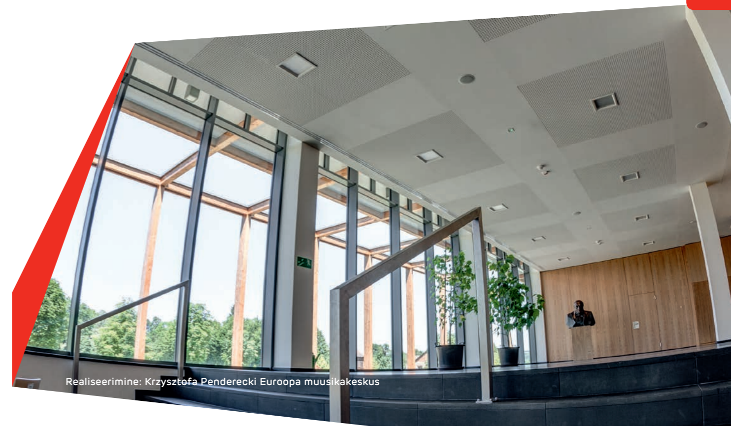
Realiseerimine: Krzysztofa Penderecki Euroopa muusikakeskus